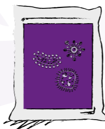
Confezioni da 1kg