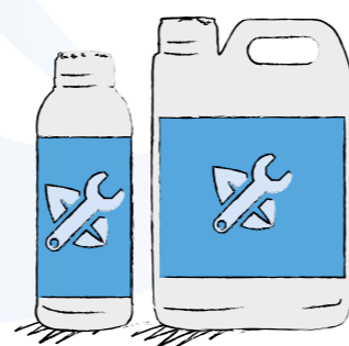
Confezioni da 1l e 5l