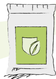
Confezioni da 5kg